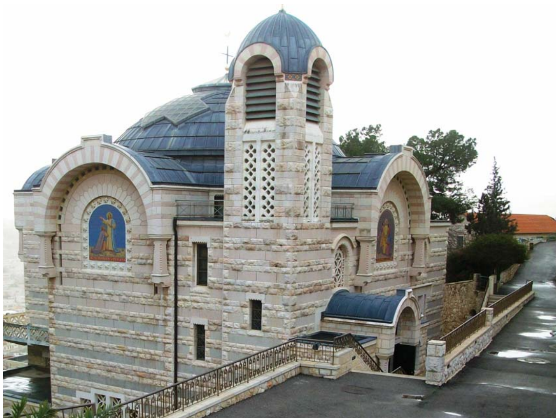
Santuario del Gallicantum - Gerusalemme aprile 2009

Il grido di fiducia e speranza di Cristo morente in Croce è, e rimane sempre, una lamentazione che porta in sé la 'disperazione' dell'uomo, di ogni uomo che soffre e che muore. Non si può lenire il grido sulla Croce perché rimane il grido dell'umana sofferenza che grida al suo Dio. Se Dio esistesse...!? Quante volte dinanzi ai dramma senza perché la domanda ritorna, ieri come oggi. Se Dio esistesse...!? Il buio della morte crocifissa oscura anche la luce di Dio e bisogna attendere l'alba della Domenica di Risurrezione per scorgere un bagliore che mai tramonterà. Ma solo la fede può passare, senza il rifiuto della logica dell'esistenza di Dio, a scorgere dietro la Croce il Risorto. Noi crediamo... e attendiamo! Quel grido arriverà anche per noi nel giorno del Giudizio, dove l'amore ci spalancherà le porte della vita senza fine; quell'amore che è stato il motivo della morte di Cristo per noi peccatori e che rimane il senso di ogni vita riuscita in Lui. Attendiamo con Maria, la Madre, lì in quel giardino dove la tomba nuova ricreerà l'umanità. Attendiamo con fiducia, speranza ed amore.